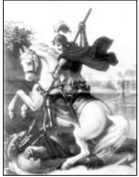
സുറിയാനി രീതിയിൽ മേടം 23-നു മാത്രമായി.

എന്നാൽ പൗരസ്ത്യ സുറിയാനി സഭാ പഞ്ചാംഗപ്രകാരം മാർ ഗീവർഗീസ് സഹദായുടെ പെരുനാൾ മേടം 24-ലും മറ്റു സഭകൾക്ക് മേടം 23-മായിരുന്നു എന്നത് ഒരു പ്രശ്നമായി. പത്തൊമ്പതാം നൂറ്റാണ്ടുവരെ ഈ പ്രശ്നം നിലനിന്നിരുന്നു. തൽക്കാലം രണ്ടു ദിവസവും പെരുനാളായി ആഘോഷിച്ചാണ് പതിനെട്ടാം പത്തൊമ്പതാം നൂറ്റാണ്ടുകളിൽ നസ്രാണികൾ പ്രശ്നം പരിഹരിച്ചത്. 1876-നു ശേഷം പെരുനാൾ പാശ്ചാത്യ