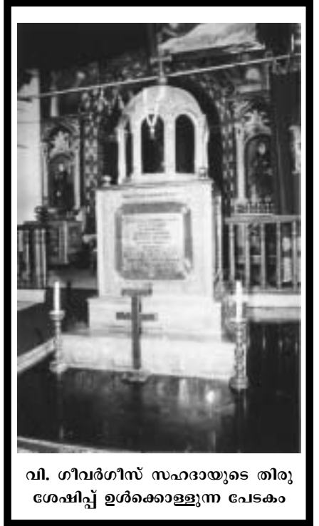
വി. ഗീവർഗീസ് സഹദായുടെ തിരുശേഷിപ്പ് ഉൾക്കൊള്ളുന്ന പേടകം

പ. വട്ടശ്ശേരിൽ തിരുമേനിയുടെ സ്വപ്നം സാക്ഷാത്കരിച്ച് പുതുപ്പള്ളിപള്ളിക്ക് സഹദായുടെ സാന്നിധ്യത്തിലൂടെ ശക്തി പകർന്നു. വി. സഹദായുടെ തിരുശേഷിപ്പ് പേടകത്തിന്റെ വടക്കുവശത്ത് പ. വട്ടശ്ശേരിൽ പിതാവിന്റെ നാമത്തിൽ മലങ്കരയിൽ ആദ്യമായി ഒരു ത്രോണോസ്സ് സ്ഥാപിച്ച് പുതുപ്പള്ളിക്കാർ ആ പരിശുദ്ധ പിതാവിനോടുള്ള ഭയഭക്തി ബഹുമാനാദികൾ പ്രകടിപ്പിച്ച് സായുജ്യം പ്രാപിച്ചു. എല്ലാവർഷവും ഫെബ്രുവരി 23 നു ശേഷം വരുന്ന ശനിയാഴ്ച പരിശുദ്ധ വട്ടശ്ശേരിൽ പിതാവിന്റെ ഓർമ്മപ്പെരുനാളായി ആഘോഷിച്ചു പോരുന്നു.