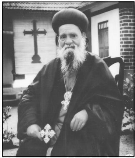
നിയെയും ഔദ്യോഗികമായി വിശുദ്ധനെന്ന് നാമകരണം ചെയ്യുന്നതിനുള്ള നടപടികൾ (ശേഷം 7-ാം പേജിൽ)

ആർദ്രമാനസനും തപോധന്യനുമായ പാമ്പാടി തിരുമേനിയെ പരിശുദ്ധനായി പ്രഖ്യാപിക്കണമെന്ന ആവശ്യം ഉയർന്നിട്ട് കാലമേറെയായി. പ. ഗീവർഗീസ് ദിതീയൻ ബാവായെയും പരിശുദ്ധ പാമ്പാടി തിരുമേ