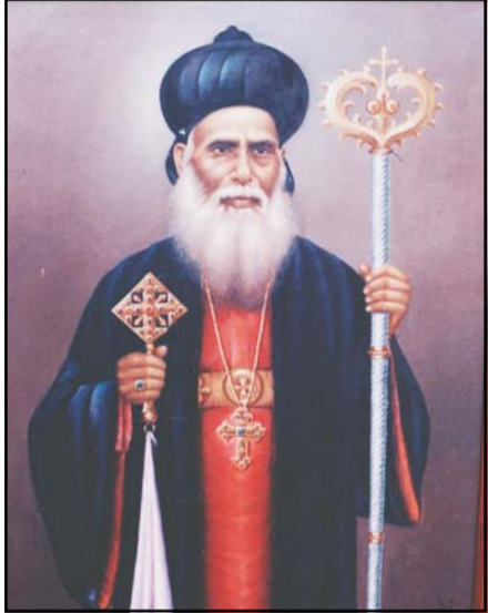
പ. മാർത്തോമ്മാ ശ്ലീഹായുടെ സിംഹാസനത്തിൽ ബസേലിയോസ് ഗീവർഗീസ് പ്രഥമൻ പൗരസ്ത്യ കാതോലിക്കാ

അകാലത്തിൽ പ. പിതാവിന്റെ ഭൗതിക ജീവിതം അസ്തമിക്കാതിരുന്നെങ്കിൽ തീർച്ചയായും പ. മാർത്തോമ്മാശ്ലീഹായുടെ പൗര