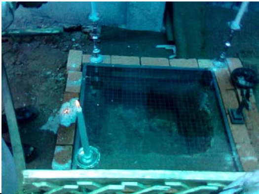
കബറിടം കണ്ടെത്തിയ സ്ഥലം