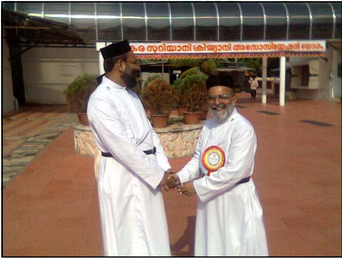
സൗഹൃദത്തിന് തെല്ലും കുറവില്ല. പരുമലയിൽ വൈദികശ്രേണി സ്ഥാനാർത്ഥികൾ പ. പരുമല തിരുമേനിയുടെ കബറിനു മുന്നിൽ രാവിലെ കണ്ടുമുട്ടിയപ്പോൾ.