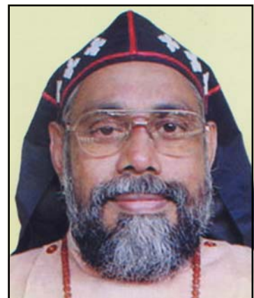
യൂഹാനോൻ മാർ മിലിത്തോസ്