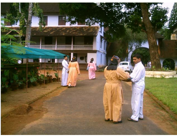
പ. സുന്നഹദോസിൽ പങ്കെടുക്കുന്ന തിരുമേനിമാർ സന്ധ്യ പ്രാർത്ഥനയ്ക്കായി പഴയസെമിനാരി ചാപ്പലിലേക്ക് പോകുന്നു.