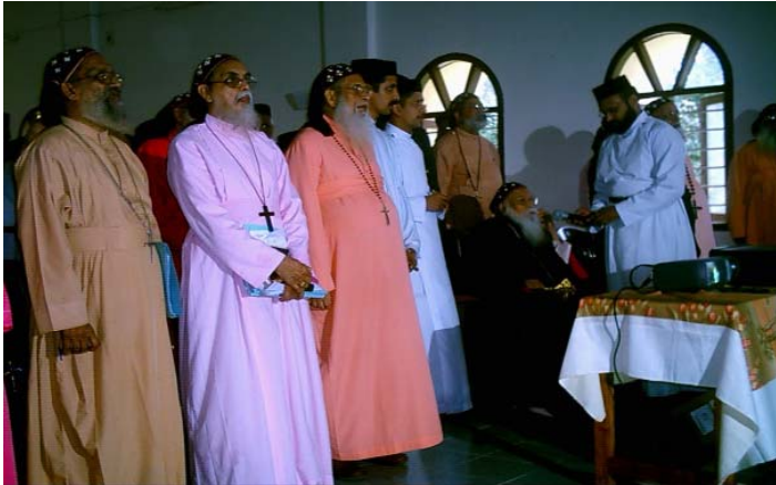
സഭയുടെ ഔദ്യോഗിക വെബ്സൈറ്റിന്റെ ഉദ്ഘാടനം പ. ബാവ നിർവ്വഹിക്കുന്നു.

ജേർണലിസത്തിൽ ബിരുദാനന്തര ബിരുദമുള്ള പുരോഹിതന്മാർ ഉണ്ടായിരിക്കുകയാണ് ഇത്തരം കക്ഷികളെയൊക്കെ ദേവലോകത്ത് വാഴിച്ചതെന്നറിയുമ്പോഴാണ് സഭാസന്ദേശികൾ ഞെട്ടുന്നത്.